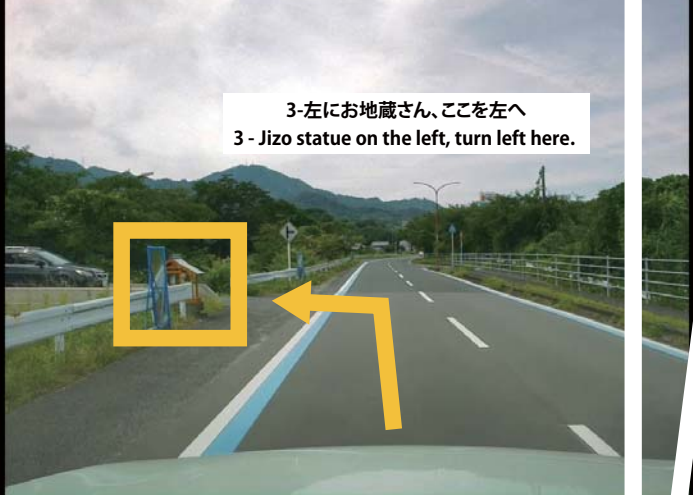
3-左にお地蔵さん、ここを左へ 3 - Jizo statue on the left, turn left here.