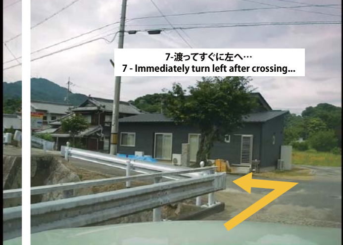
7-渡ってすぐに左へ… 7 - Immediately turn left after crossing…