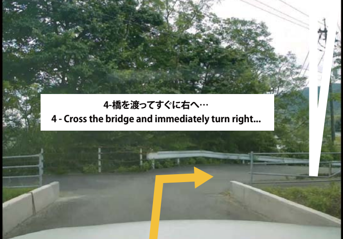
4-橋を渡ってすぐに右へ… 4 - Cross the bridge and immediately turn right…