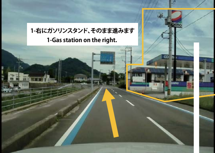
1-右にガソリンスタンド、そのまま進みます 1-Gas station on the right.