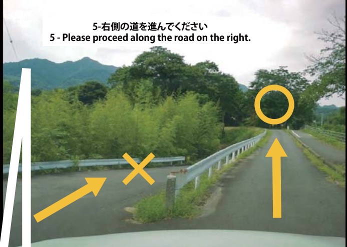
5-右側の道を進んでください 5 - Please proceed along the road on the right.