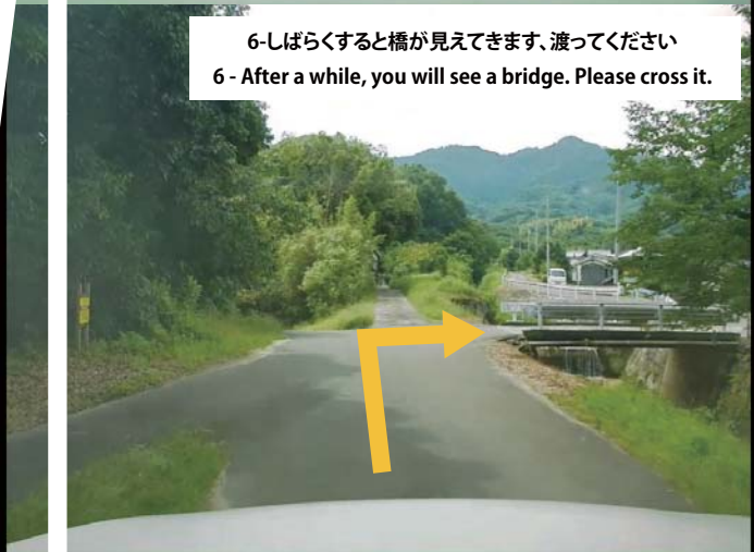
6-しばらくすると橋が見えてきます、渡ってください 6 - After a while, you will see a bridge. Please cross it.