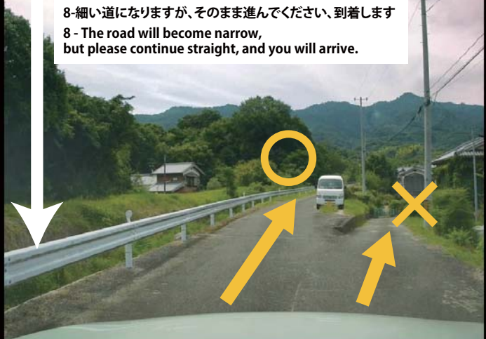
8-細い道になりますが、そのまま進んでください、到着します 8 - The road will become narrow, but please continue straight, and you will arrive.